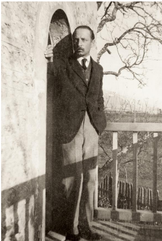
Rilke vor dem Eingang zum Schloss Muzot in Sierre (1923)

Der weitere Lebensverlauf Rilkes ist bekannt. Bis 1907 folgen Wanderjahre, die ihn unter anderem nach Rom, Kopenhagen, Wien führen, dann, bis 1914, Meisterjahre, die durch eine enge Freundschaft mit der Fürstin Marie von Thurn und Taxis geprägt sind und in denen «Die Aufzeichnungen des Malte Laurids Brigge» und die ersten «Duineser Elegien» entstehen. Reisen führen ihn nach Nordafrika und Ägypten. Die Lähmung, die der Erste Weltkrieg bewirkt, löst sich während der Schweizer Jahre von 1919 bis 1926 auf wunderbare Weise. Sierre im Wallis spielt dabei eine besondere Rolle. Im Château Muzot, das er 1921 bezieht, vollendet er die «Duineser Elegien», schreibt er die «Sonette an Orpheus» nieder. Eine spät erst erkannte Leukämie-Erkrankung zwingt ihn ab 1924 immer wieder zu Kuraufenthalten. Am 29. Dezember 1926 stirbt er in Valmont. Sein Leichnam wird am 2. Januar 1927 auf dem Friedhof in Raron beigesetzt.