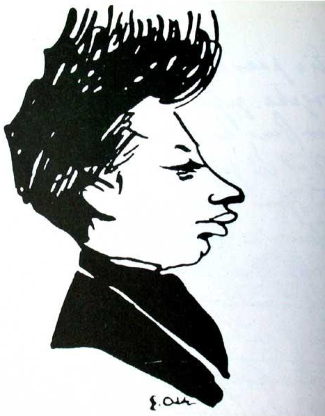
Rilke 1896 in einer Karikatur von Emil Orlik

Einführung in Rilkes dramatisches Frühwerk