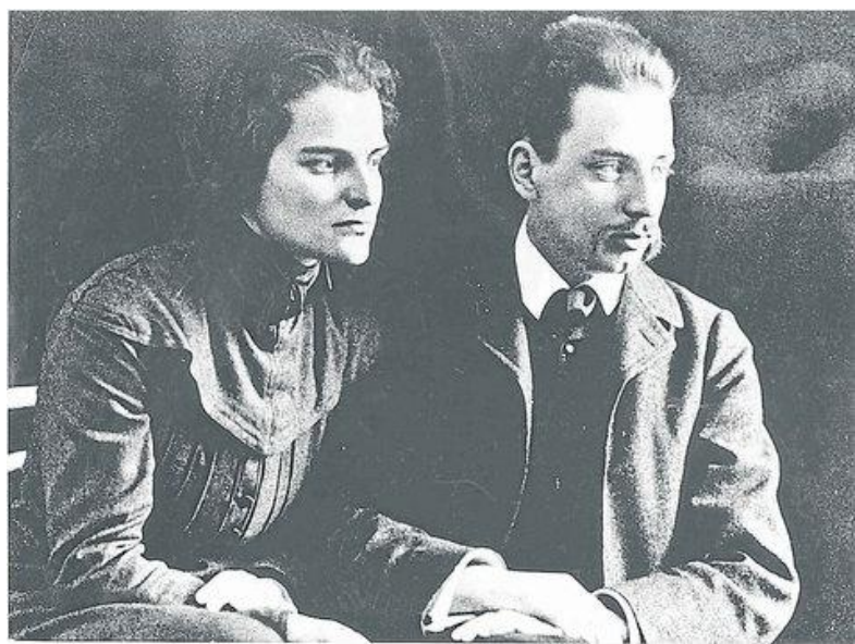
Clara Rilke-Westhoff und Rainer Maria Rilke (1906)