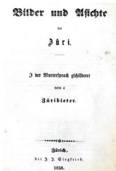
Titelblatt «Bilder und Asichte vo Züri» von 1858.

Sonntag, 9. Juni 2024, 11 Uhr Führung zum «Niedergang der Heimweberei»