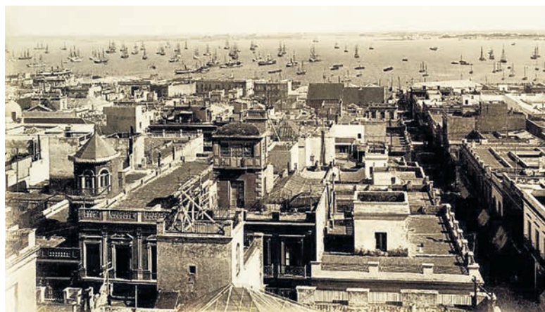
Montevideo, Hafen, 1880 – Jakob Senn: «... dem in des Südens heitrer Pracht auch nicht ein holdes Dämmerstündchen lacht.»