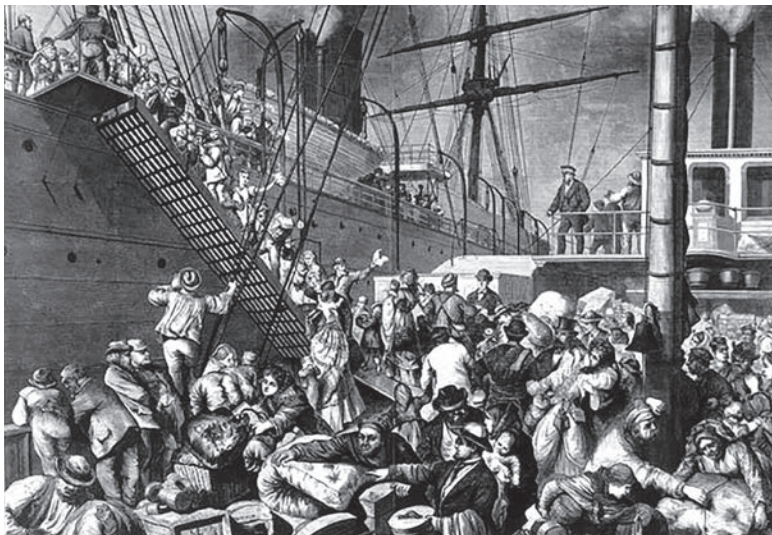
Einschiffung und Überfahrt nach Übersee im 19. Jahrhundert.